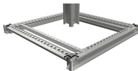
New Top / Bottom frame shape

• Šroubovaná a svařovaná pevná konstrukce. Vylepšený design skříně odráží její kvalitu a tuhost. Nový patentovaný horní a spodní rám spolu s rohovým fixačním systémem poskytuje vysokou úroveň robustnosti schopnou unést 1500 kg statického zatížení.