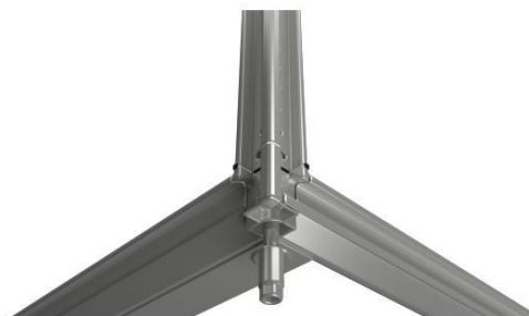
New patented corner & fixation system